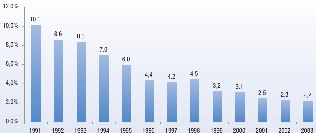
Gráfico 1 Evolución de la Provisión para Financiamientos Comprometidos, 1991 - 2003 (porcentajes del gasto total)